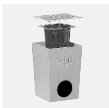
Dvorový vpust z polymérbetónu s krycím roštom z pozinkovanej ocele.