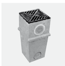
Dvorový vpust z polymérbetónu pre napojenie strešného zvodu. Krycí rošt z liatiny.