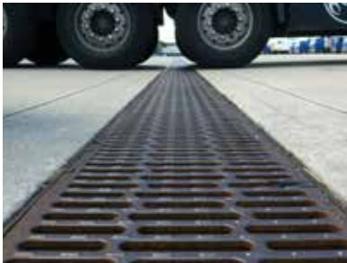
Terminal Werndorf, Steiermark ACO DRAIN® SK