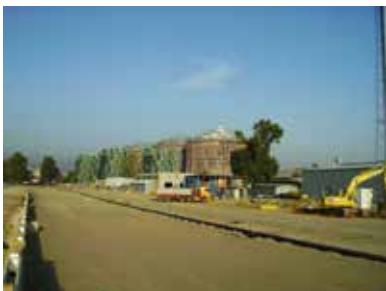
Gaswerk Simmering, Wien ACO Qmax®