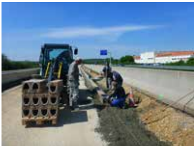
Autobahn A4, Burgenland ACO DRAIN® Monoblock